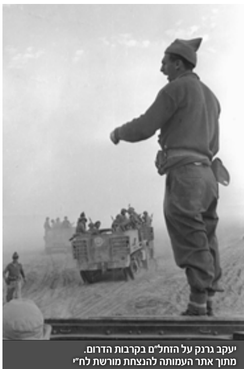
יעקב גרנק על הזחלים בקרבות הדרום.

לאה מספרת: "הוא קנה לי טבעת ואמר, 'אם את מורידה את הטבעת יקרה לי משהו'. כשאת חיה חיי מחתרת את לא מעיזה להעמיד משפט כזה בניסיון. יבשתי ליד אמא שלי ופתאום היא ראתה טבעת עם שלוש אבנים, תפסה את הטבעת ורצתה להוריד אותה כדי לראות. משכתי את היד מהר. באותו יום דב נפצע."