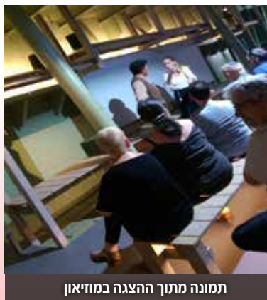
תמונה מתוך ההצגה במוזיאון